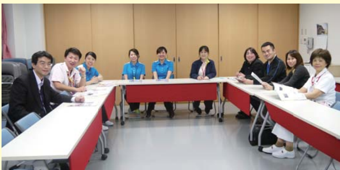
医療法人清和会 水前寺 広報部会

地域の皆さまとのつながりを大切 にしたいという思いから地域交流 誌としての位置づけで発行を続け てきました。 取材・編集作業は全て広報部会に 所属する病院・施設の職員が行っ ており手作り感を大事にしていま す。これからも読者の皆さまと医 療法人清和会をつなぐ交流誌とし ての役割を担っていかうと100 号を目指して編集スタッフも張り 切っているところです。 地域に関する情報もどしどし掲載 していきますので、ご意見等いた だければ幸いです。