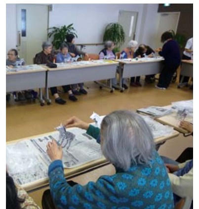
カレンダーの裏に型紙を貼って、お好みの馬を作っていました。