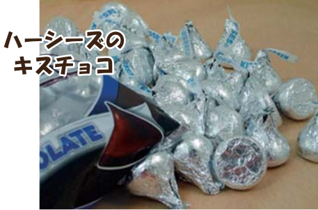
ハーシーズの キスチョコ

培が促進されることとなります。当時の植民地政 策とも重なって中南米、アフリカ、東南アジア諸国 でプランテーション作物としてカカオ豆が植栽され ました。従って古くからカカオ豆生産を支えて来た のはサトウキビやコーヒー豆と同様に奴隷労働によ るものでした。現在もカカオ豆は西アフリカが主な 産地となっていますが、受け継がれた負の連鎖は、 今なお児童・貧困労働などの社会問題を孕んでお り、先物取引市場で、マネーゲームの対象にもなっ ており、しばしば経済性と人道的問題が取り沙汰 されます。我が国で広くチョコレートが認知される のは、戦後アメリカ進駐軍によつてです。“Give Me Chocolate”は当時を物語る言葉として度々紹介さ れます。戦後食料難の時代に、当時の子供達は甘 いチョコレートに何を感じたのでしょうか？（*注）