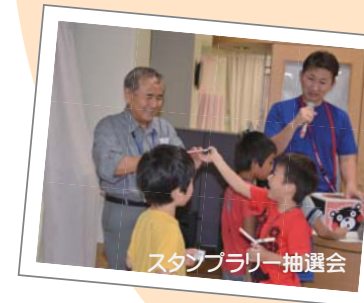
スタンプラリー抽選会