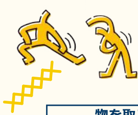
物を取るときの姿勢