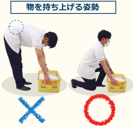
物を持ち上げる姿勢

上の荷物を取る時には、左の写真のように無理に取ると腰部が過度に反ってしまい腰に負担がかかってしまいます。こういった際は右の写真の様に台に乗るようにして荷物の高さは目線の位置になるようにしましょう。 ※使用する台はしっかりと安定するものを選んでください。