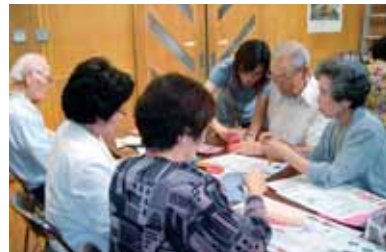
自主活動(折り紙)のお手伝い。

第4水曜日 10時～ 出水校区 心と体のいきいき教室 出水地域コミュニティセンターにて