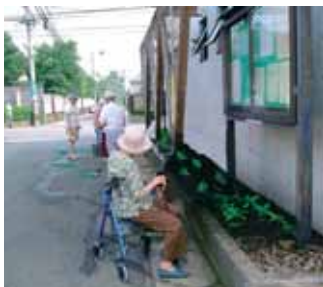
出水地域コミュニティセンター前の花苗植え