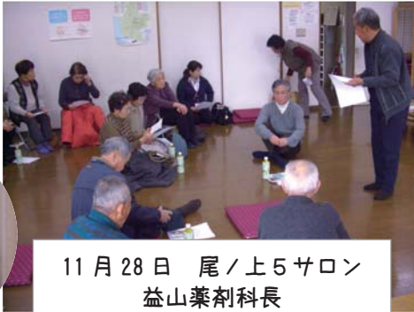
11月28日 尾ノ上5サロン 益山薬剤科長 「漢方薬について」