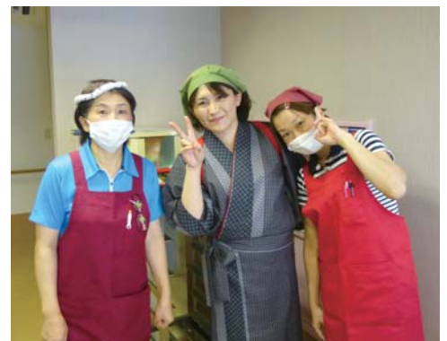
栄養科スタッフが腕を振りました