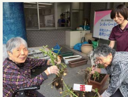
ジャガイモ収穫だよ～