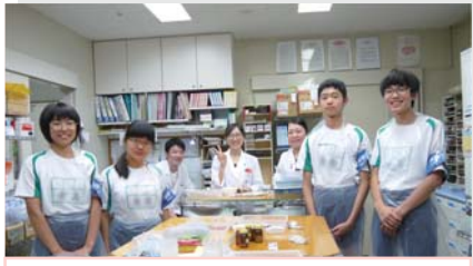
薬剤部にて。薬剤の管理、患者誤認防止のための取り組み等について学んでもらいました。

高齢者体験では、肘や膝、手首や足首に重りを、目には視野が狭くなるゴーグル、耳にはヘッドホンをつけ、歩行や階段昇降をしてもらいました。普段何気ないしぐさも、高齢になることでとても大変であることを実感し、自分たちの祖父や祖母の大変さが分かったとの意見も聞かれました。