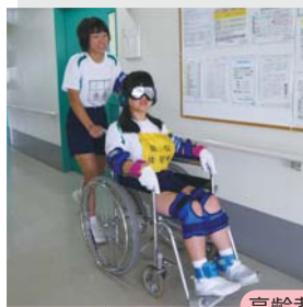
高齢者体験の様子

他にも薬剤部、リハビリテーション部、栄養部、事務部等においても、それぞれの業務を見学・体験してもらいました。ナイストライでは普段の生活では体験できないことに、たくさん触れる良い機会になったと思います。この体験をもとにさらに医療職に対して興味を持ち、将来への夢へとつなげて欲しいです。