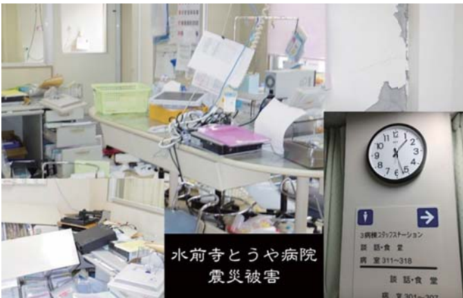
散乱するスタッフステーションと本震で止まった病棟廊下の時計

震災前より月に1回土曜健康サロンを開催していたのですが、自分達の生活もままならないスタッフの後押しもあり、地震から1ヶ月後の2016年5月14日に開催できました。『地震に勝つ』との思いで、一品料理として『鰹(勝つ魚)のカツ(勝つ)』を提供しました。6月には支えてくれた人達への感謝を込めて本誌第63号に『たいざんぼくの思い』の表題で寄稿しました。今思えば、震災という困難を目にして、『何とかし