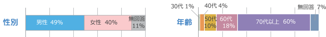
【実施期間】2026年2月2日(月)～27日(金) 【回答数】182件

水前寺とうや病院では、外来患者さまを対象としたアンケートを実施しました。ご協力いただいた皆さまに感謝申し上げます。結果についてご報告いたします。皆さまから頂いた貴重なご意見は院内で共有し、今後も病院運営に活かしてまいります。