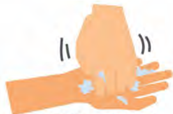
手洗いでアルコール消毒でも、指先や爪の間を念入りにこすります。

スクを着用することには次の3つの目的があります。 (1) 飛沫を飛ばさない、 (2) 飛沫を吸い込まない、 (3) 鼻や口に手が触れるのを防ぐ。 マスクの質や着け方が大切だと言われる理由は、鼻や口は呼吸することでウイルスを積極的に吸い込んでいるからです。したがって、マスク表面はウイルスで汚染されています。